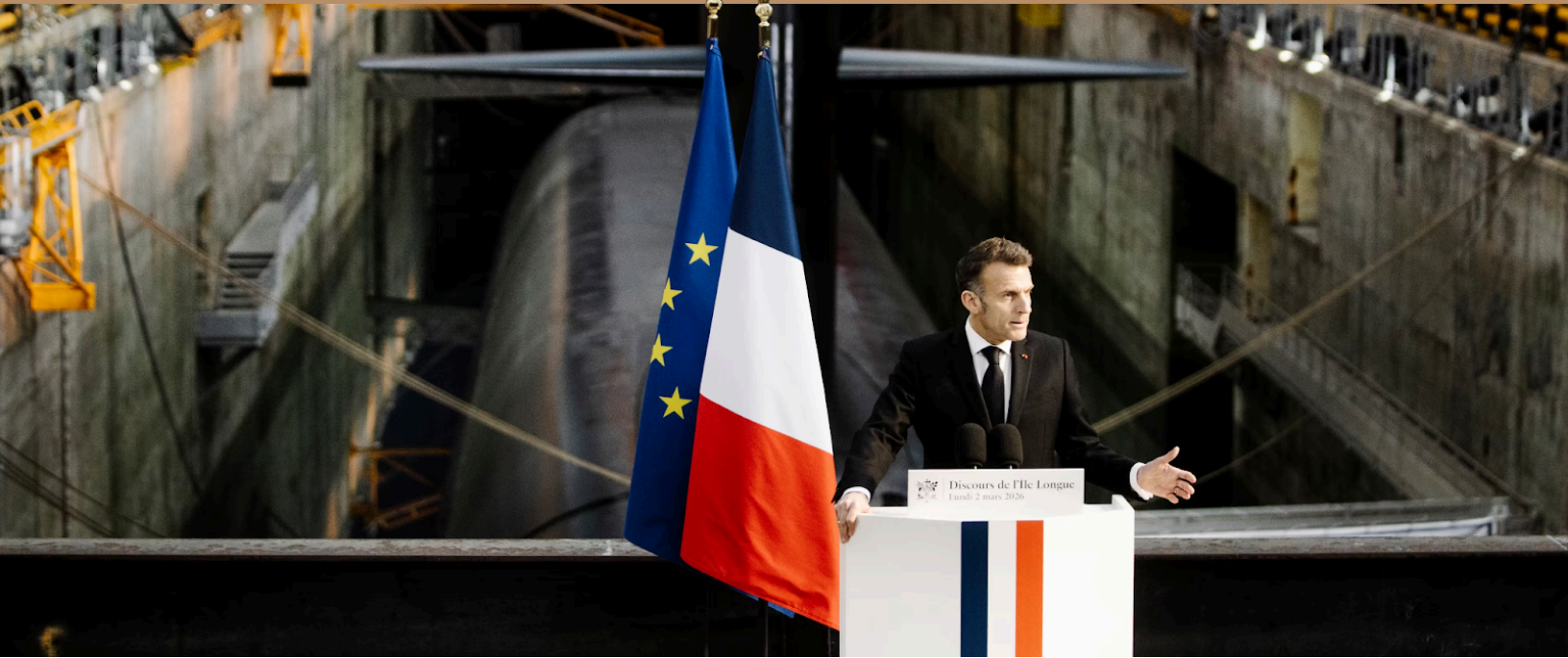
Image n°6 : Emmanuel Macron, lors de son discours sur la doctrine nucléaire française, devant le sous-marin nucléaire « Le Téméraire », à la base opérationnelle de l'île Longue (Finistère), le 2 mars 2026.

Le débat sur l'eupéanisation de la dissuasion nucléaire française a longtemps relevé du non-dit. À Paris, le sujet était connu. À Berlin, il restait sensible. À Varsovie, il paraissait encore lointain. Or, depuis plusieurs mois, ce qui relevait hier de l'hypothèse est entré dans le champ des discussions stratégiques concrètes. Ce déplacement du débat ne doit rien au hasard. Il résulte de la poursuite de la guerre en Ukraine, des menaces nucléaires russes répétées et, surtout, de l'inquiétude croissante suscitée en Europe par la solidité de l'engagement américain (Bienvenu et al., Le Monde, 2 mars 2026 ; Kauffmann, Le Monde, 12 mars 2025).