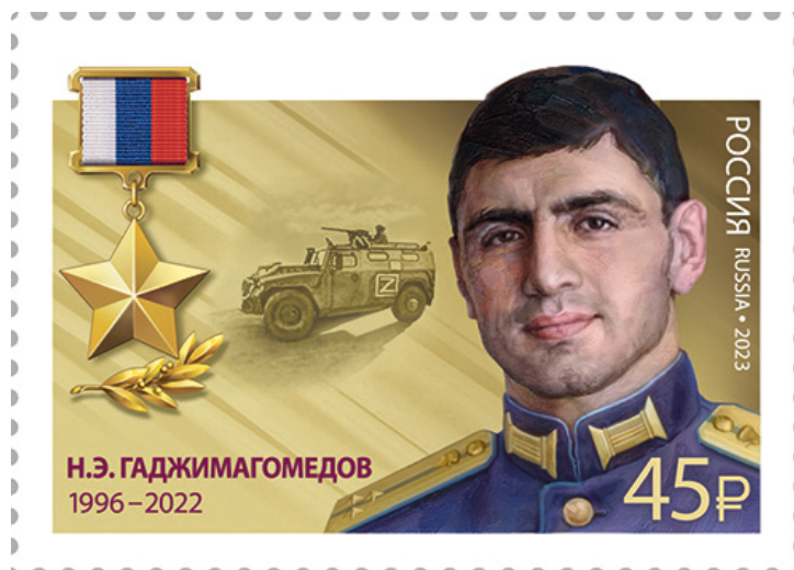
Image n°4 : Timbre commémoratif en la mémoire Nurmagomed Gadzimagomedov réalisé par la Poste russe en 2023.