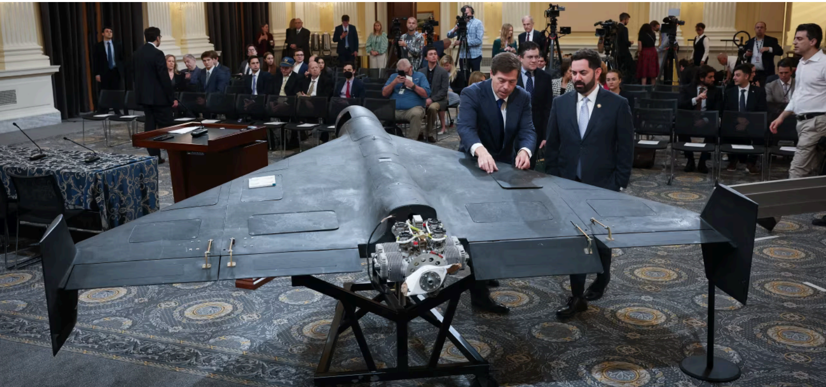
Image n°12 : Photographie d'un drone Shahed 136, 2024.