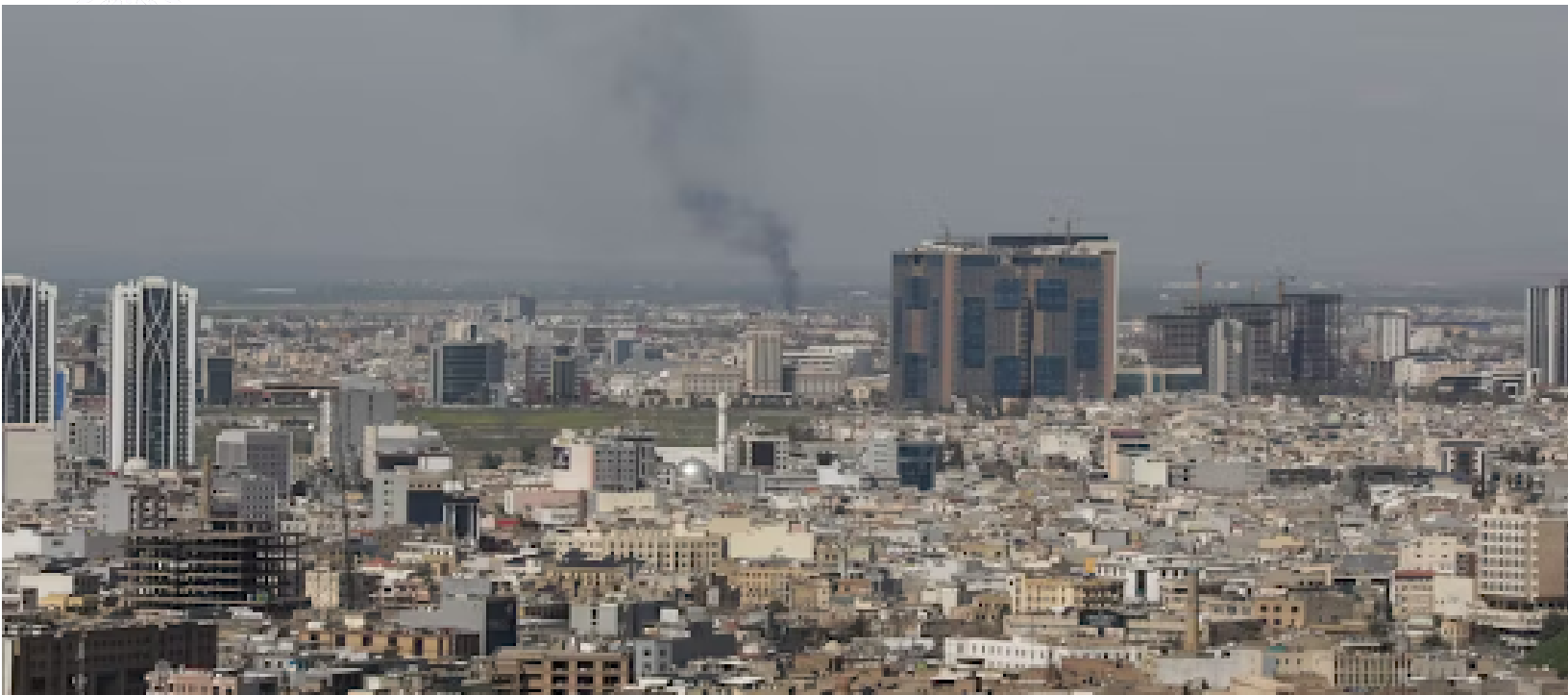
Image n°11 : Fumée noire sur Erbil, au Kurdistan irakien, après l'interception d'un drone, le 12 mars 2026.

Soutenir ses partenaires sans entrer en guerre. Condamner certaines opérations sans rompre avec ceux qui les conduisent. Parler le langage du droit sans oublier celui du rapport de force. Telle est la ligne française face à la guerre autour de l'Iran. Une ligne étroite, utile, mais de plus en plus coûteuse.