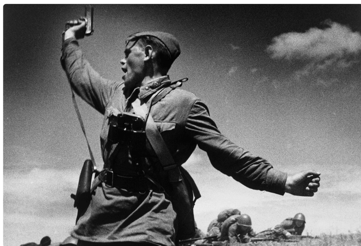
Image n°2 : Une photographie de Max Alpert, emblématique de la Grande Guerre patriotique, représentant Aleksei Gordeyevich Yeryomenko, officier politique quelques minutes avant sa mort le 12 juillet 1942, près du village de Khoroshee (dans l'oblast de Vorochilovgrad) en Ukraine.

C'est dans ce contexte de construction d'une nation et d'une économie que la figure d'Alekseï Stakhanov émerge en « héros du travail socialiste » à l'occasion de son exploit surhumain de 102 tonnes de charbon extraites en seulement 6 heures lors d'un concours du komsomol local (Depretto, 1982). Très vite, il devient un héros national attachant son nom aux exploits des ouvriers soviétiques dévoués infiniment au parti et à l'idéal socialiste proclamé. La figure est telle qu'elle dépasse les frontières finissant sur la couverture du Times, le héros du Donbass devient alors héros des Hommes. Mais en Union soviétique, l'élan sacralisant s'intensifie aussi, allant même jusqu'à renommer la ville où est présente la mine de charbon de l'exploit à son nom à titre posthume en 1978 (Masuy, 2015).