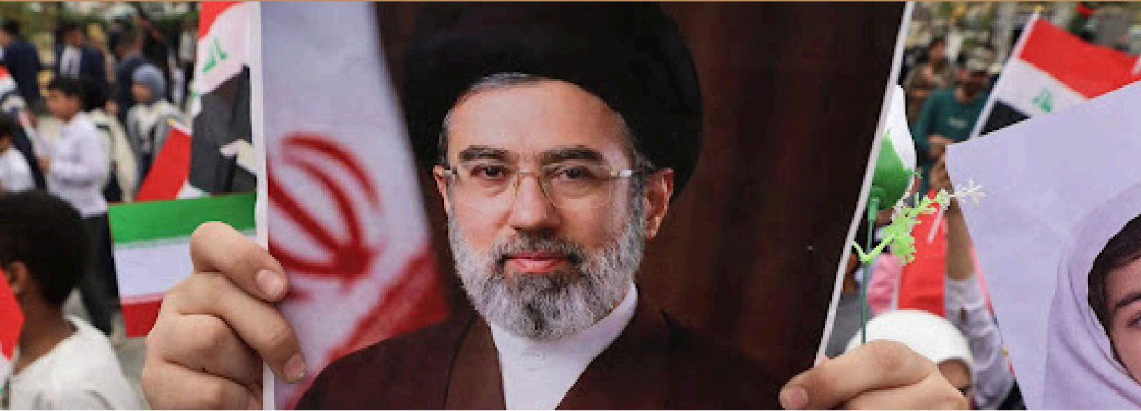
Image n°16 : Manifestant tendant un portrait d'Ali Khamenei

Suite à la mort de Ali Khamenei, le Guide Suprême de l'Iran, les interrogations se multipliaient quant à sa succession. Son fils, Mojtaba Khamenei a finalement été nommé comme nouveau Guide Suprême le 8 mars 2026, journée symbolique puisqu'il s'agit de la Journée Internationale des Femmes. Cette coïncidence fortuite n'est pas sans nous rappeler le mouvement de protestations qui avait embrasé l'Iran en 2022 suite à l'assassinat d'une jeune femme iranienne.