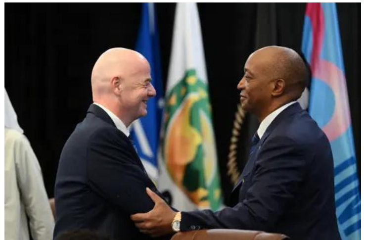
Image n°9 : Le Président de la Confédération Africaine de Football (CAF) félicite le Président Gianni Infantino pour sa réélection en tant que Président de la FIFA en 2023

La période 2024-2030 constitue un moment charnière dans l'histoire du football africain. Sous la présidence de Patrice Motsepe depuis 2021, la Confédération africaine de football (CAF) accélère un virage structurel vers un modèle néolibéral, dominé par des logiques d'interdépendance asymétrique et de soft power institutionnel. Ce tournant ne saurait être réduit à une simple adaptation technique au calendrier mondial, car il incarne, au contraire, une reconfiguration profonde des rapports de puissance au sein du système footballistique global, où la CAF, autrefois vecteur d'émancipation panafricaine, se trouve progressivement reléguée au statut d'acteur périphérique. Cette évolution s'inscrit dans une tension théorique triangulaire déjà esquissée qui met en lumière l'anarchie persistante du football mondial, où la FIFA exerce une hégémonie de fait en imposant ses priorités pour préserver les intérêts des ligues européennes dominantes. Cette même tension révèle comment les mécanismes de coopération (financements, règles communes, audits) masquent une perte d'autonomie réelle. La théorie de la dépendance, revisitée par des auteurs comme Samir Amin, explique comment les flux économiques (talents, capitaux, infrastructures) perpétuent une structure centre-périphérie qui vide le football africain de sa souveraineté substantielle.