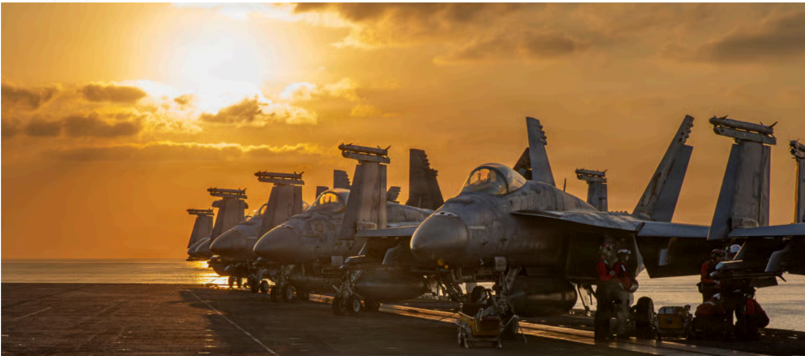
Image n°10 : Des chasseurs de l'US Navy stationnés sur le pont d'envol de l'USS Abraham Lincoln, le 3 mars 2026

Le 3 janvier 2020, un drone américain MQ-9 Reaper frappait le convoi du général Qassem Soleimani à l'aéroport international de Bagdad. En quelques secondes, l'une des figures les plus puissantes du dispositif sécuritaire iranien disparaissait dans une boule de feu. Commandant de la Force Qods des Gardiens de la Révolution islamique, architecte de l'influence régionale de Téhéran au Liban, en Syrie, en Irak et au Yémen, Soleimani incarnait à lui seul la doctrine de guerre asymétrique développée par l'Iran depuis la révolution de 1979. La réplique iranienne ne tarda pas : une salve de missiles balistiques Qiam s'abattit sur la base américaine d'Aïn al-Assad en Irak. Aucun soldat américain ne fut tué — les États-Unis avaient été avertis en amont —, mais le message était sans ambiguïté : l'Iran pouvait frapper directement les forces américaines sur leur sol de déploiement.