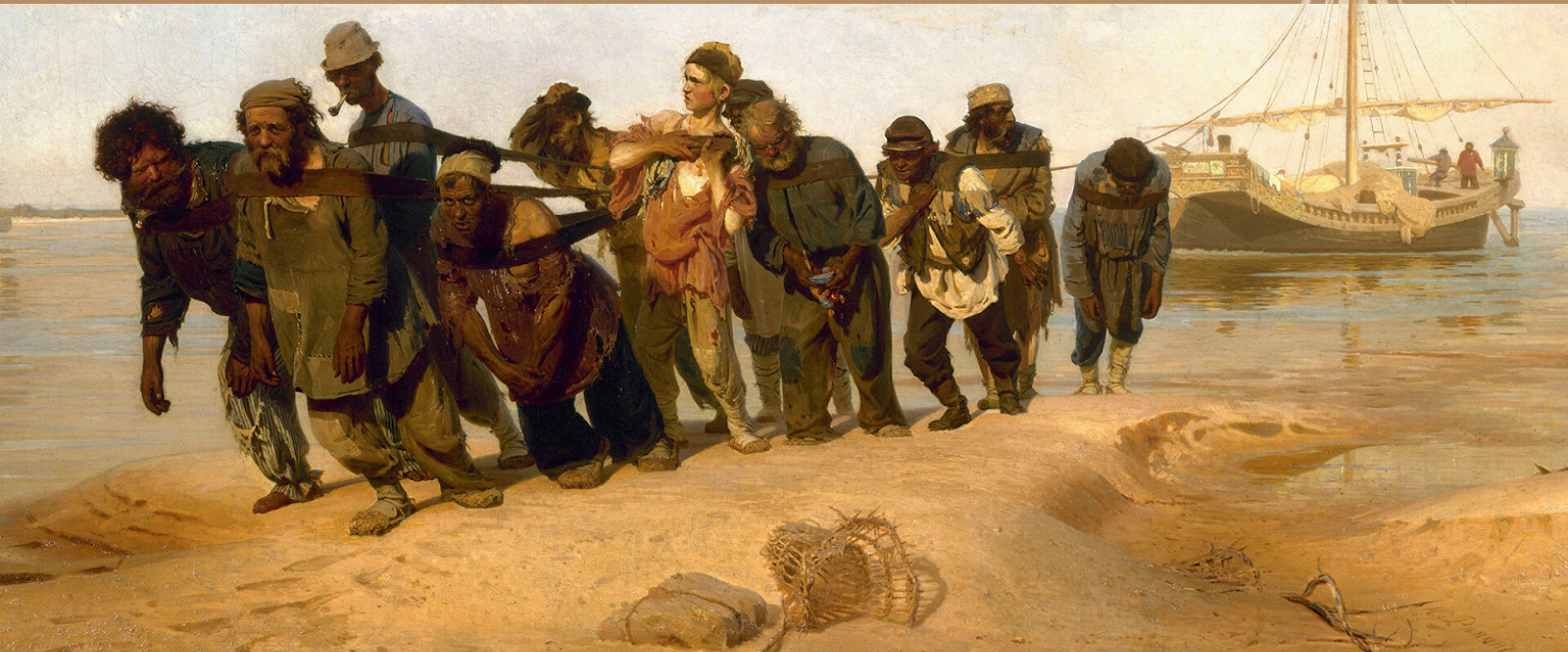
Image n°1 : Les bateliers de la Volga, simples bourlaques (journaliers) traînant dans la peine autant un bateau qu'une nation, un mythe de l'héroïsme populaire russe peint par Ilya Répine, 1870-1873, Musée Russe, Saint-Pétersbourg