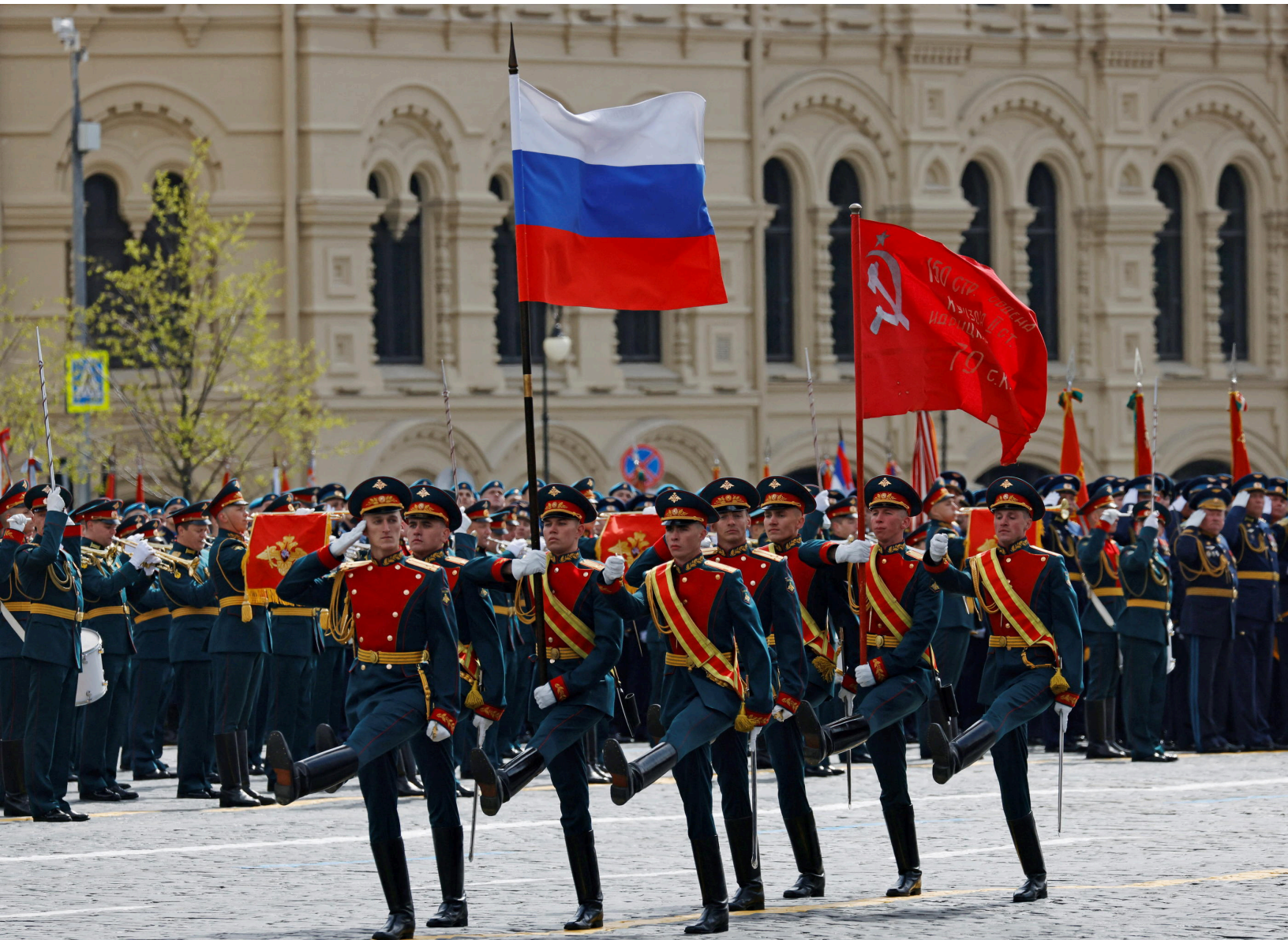
Image n°5 : Photographie du défilé de la victoire où des soldats honorifiques tiennent le drapeau russe (gauche) et le drapeau de la victoire (droite), le 9 mai 2025.

Ainsi, Alexandre Nevski est à la fois le guide des Novgorodiens face aux menaçant teutons mais aussi le fondateur d'un regard vis-à-vis des germains, des hérétiques, de l'étranger en général qui marque encore largement aujourd'hui la société russe. Au creux des récits individuels se niche une légende partagée, idéalisée. En conséquence, le héros est un pur produit de sa société mère qui choisit de le faire émerger, de le mythifier, de le pérenniser ou bien de le remodeler. Ainsi, les héros, les symboles et les valeurs apportés à travers eux représentent un parfait chemin pour aborder les sociétés humaines et tout particulièrement la société russe qui est profondément marquée par la symbolique. Enfin pour reprendre les mots de Durkheim, grand penseur de la sociologie, lorsque les héros se montrent à nous, c'est la société qui se dévoilent en eux.