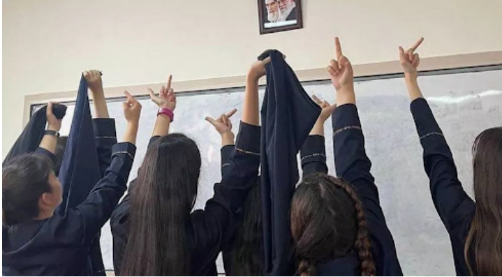
Image n°17 : Jeunes femmes retirant leur voile et tendant leur majeur devant un portrait d'Ali Khamenei

Cet évènement, ayant choqué toute la population du pays, tant les femmes que les hommes, pousse alors les femmes à sortir et manifester, danser et se filmer en train d'ôter puis de brûler leurs voiles devant la police en criant « femme, vie, liberté ! ». Le fait de brûler le voile est un geste montrant que le zoroastrisme, l'ancienne religion de la Perse, pour laquelle le feu est important et sacré, a une certaine influence dans la société iranienne, sans que ces derniers ne s'en rendent forcément compte.